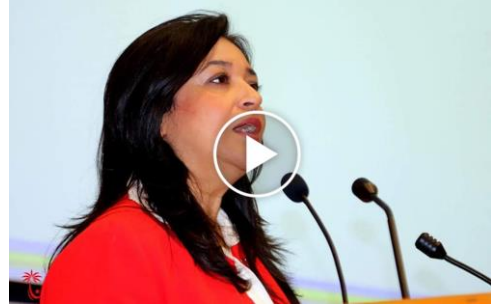
عمر الطبطبائي نائبة بمجلس الشورى البحريني وبالبرلمان العربي ورئيسة لجنة الشؤون التشريعية والقانونية بالبرلمان العربي البحرين