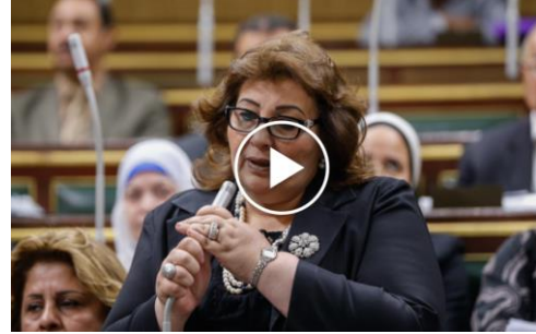
سماح ديمق عضوة بمجلس الشعب ورئيسة لجنة شؤون المرأة والأسرة والطفولة والشباب والمسنين تونس