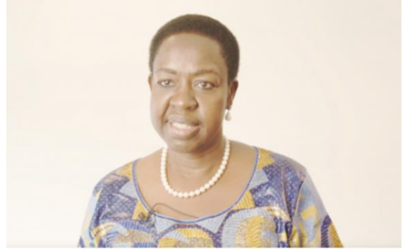
جيما نونو سامبا، رئيسة المجلس الوطني الانتقالي لجنوب السودان