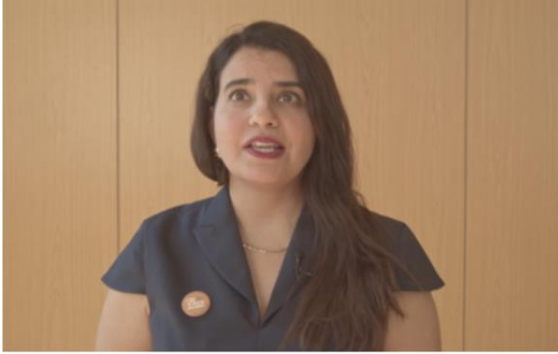
سحر البزار ، رئيسة منتدى الاتحاد البرلماني الدولي للشباب