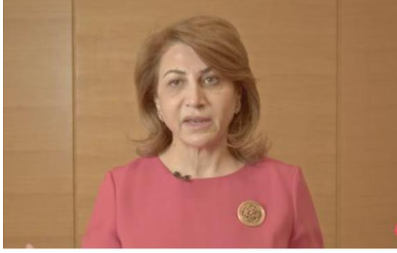
آلا طالباني، عضو مجلس النواب العراقي