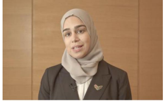
سارة محمد فلكناز ، عضو المجلس الوطني الاتحادي لدولة الإمارات العربية المتحدة