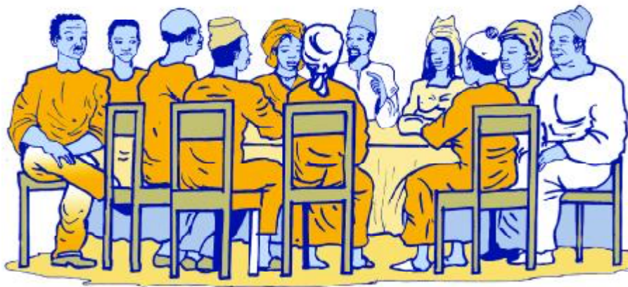
Un conseil communal de 11 membres

Le Conseil communal règle, par ses délibérations, les affaires de la commune, notamment celles relatives aux programmes de développement économique, social et culturel (art.14)