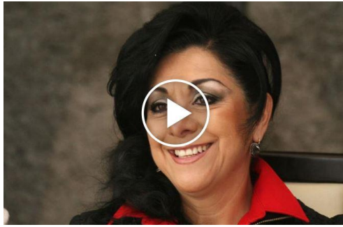
Lucero Saldaña Senadora México