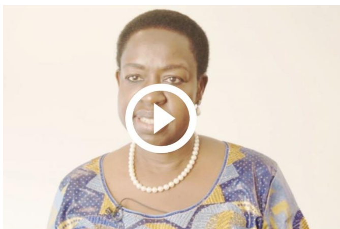
Jemma Nunu Kumba, Présidente de l'Assemblée législative nationale de transition, Soudan du Sud