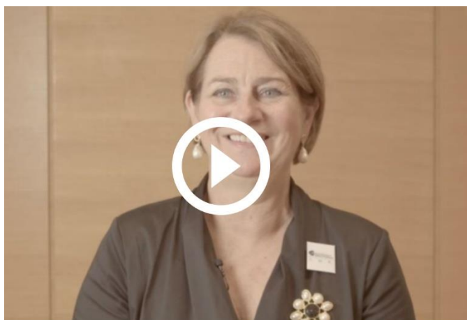
Tone Wilhelmsen Trøen, Ex-présidente du Parlement/Storting, Norvège