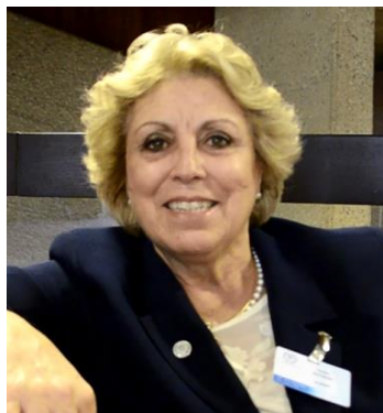
Fouzia Benbadis, Vice-présidente du Conseil de la nation algérien