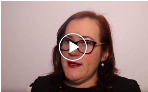
Janet Camilo Ministra de la Mujer, República Dominicana