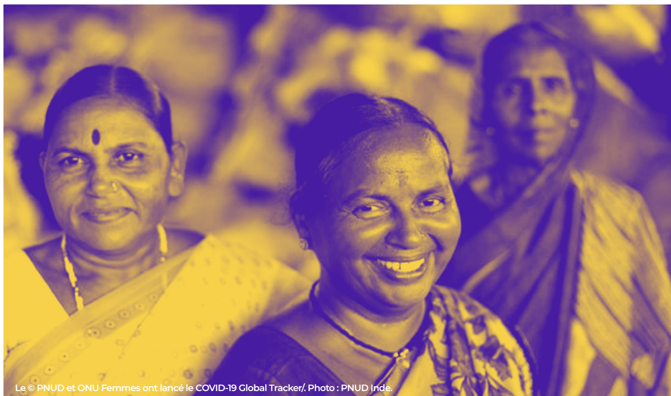
Le © PNUD et ONU Femmes ont lancé le COVID-19 Global Tracker/.

Dans ce contexte, le PNUD est tout à fait capable d'adopter une approche mobilisant l'ensemble de la société et d'aider les gouvernements à multiplier les choix de développement national qui fonctionnent pour tous. Au cours des 56 dernières années, le PNUD a su gagner en crédibilité et susciter la confiance. Sa présence dans 170 territoires pour défendre le lien entre l'action humanitaire et le développement lui permet de jouir d'une vision à 360 degrés de la société des pays où il opère. Dans la présente Stratégie pour la promotion de l'égalité des sexes, il appelle à prendre des mesures ambitieuses, l'égalité des genres comptant parmi les contributions les plus importantes au développement humain et durable que le PNUD peut apporter en tant qu'organisation.