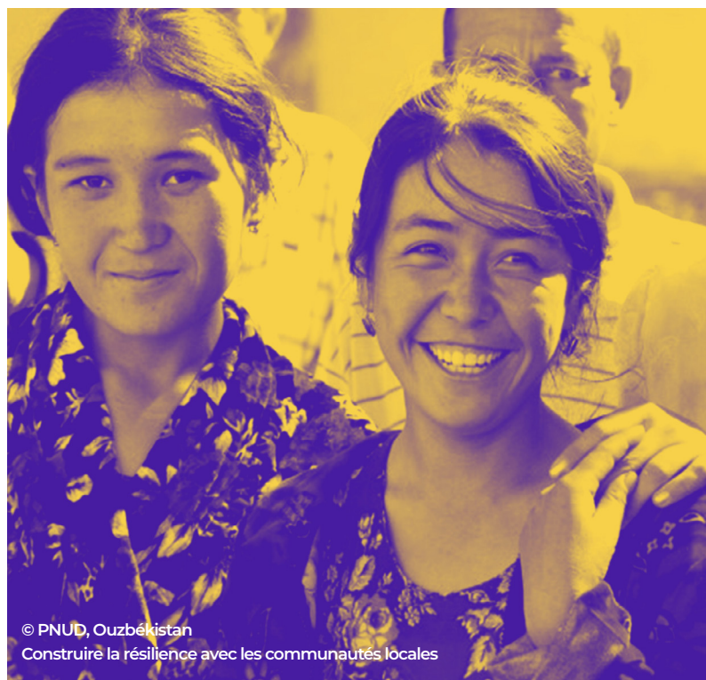
Construire la résilience avec les communautés locales

Réduction et gestion des risques de catastrophe tenant pleinement compte des questions de genre. Plusieurs études révèlent que le taux de létalité lié aux catastrophes est beaucoup plus élevé pour les femmes les plus pauvres du fait, en grande partie, de différences entre les sexes pour faire face à de tels événements, à l'instar de l'accès insuffisant aux informations et aux alertes rapides. Dans le même temps, les femmes sont des agents clés du changement positif dans la réduction et la gestion des risques de catastrophes. Le PNUD continuera de veiller à ce que toutes les stratégies de développement fondées sur les risques, les mesures d'alerte rapide et de préparation et les évaluations après les catastrophes intègrent l'égalité des genres, notamment en exploitant des critères de mesure innovants tels que l'indice de résilience des femmes, créé avec ActionAid au Cambodge. Les efforts visant à recenser et remettre en question les structures qui empêchent l'exercice des responsabilités par les femmes et leur participation s'accompagneront d'un