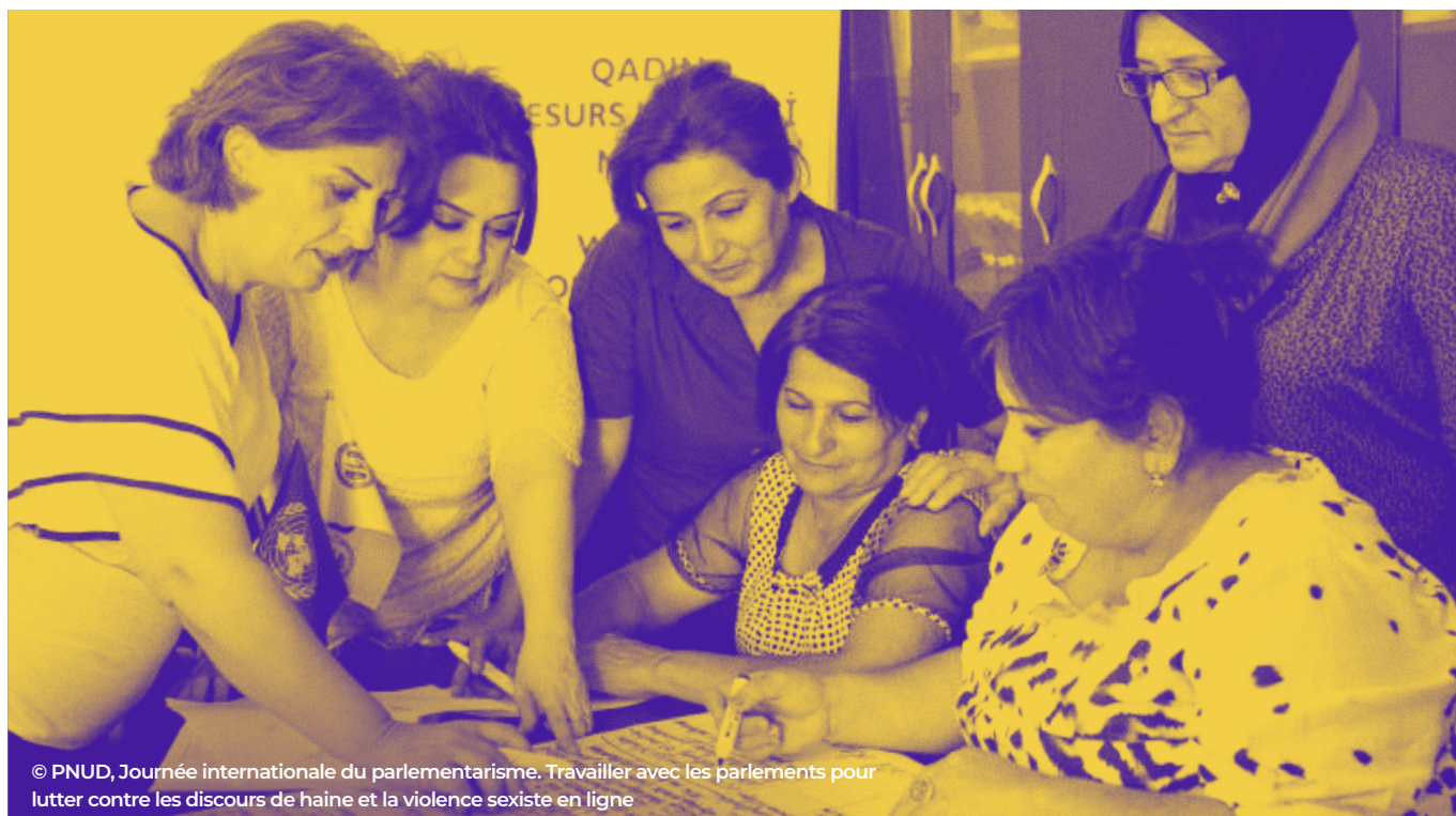
© PNUD, Journée internationale du parlementarisme. Travailler avec les parlements pour lutter contre les discours de haine et la violence sexiste en ligne

Instaurer la justice de genre pour réaliser les droits. Dans son programme mondial sur le renforcement de l'état de droit et des droits humains, le PNUD met l'accent sur la justice de genre en soutenant plus de 48 pays et contextes touchés par une crise, une fragilité ou un conflit. Avec le concours de partenaires comme ONU-Femmes et grâce à des initiatives telles la Plateforme pour la justice